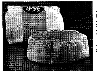
主力商品の「まあるいカスタラ」

これまでの長崎堂は成とって来たが、新たな客層の掘り起こしを目指して、こだわりの味を追求した新ブランドを立ち上げることにした。コンセプトは「女性に愛される和風モダン」。主力商品の「まあるいカスタラ」など9品目を販売